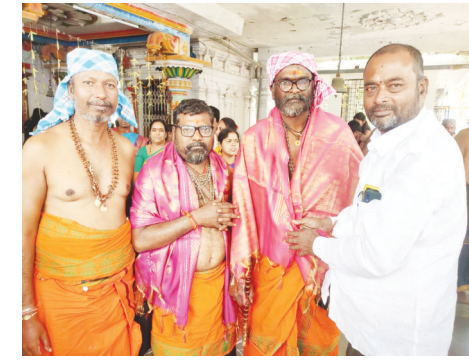
శబరిమల శబరిమల అయ్యప్ప స్వామి దీక్షలో భాగంగా 41 రాష్ట్ర కార్యదర్శి పేరుకొన్నారు.