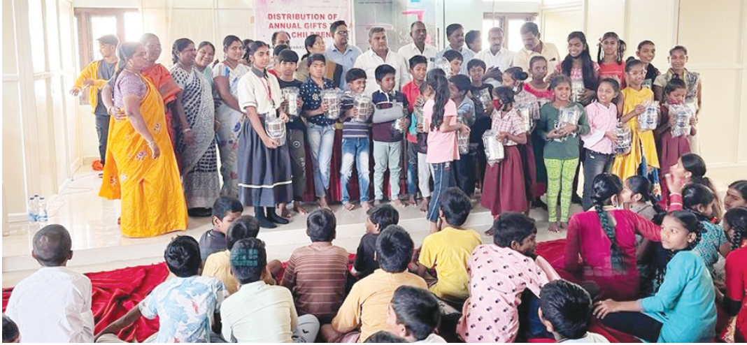
(మేడ్చల్ హాట్ షీ కాలనీ/శుభ తెలంగాణ/22డిసెంబర్)మీర్చిపేట్ హాట్ షీ కాలనీ డివిజన్ పరిధిలోని రాజీవ్ నగర్ కాలనీ కమ్యూనిటీ హాట్ నందు