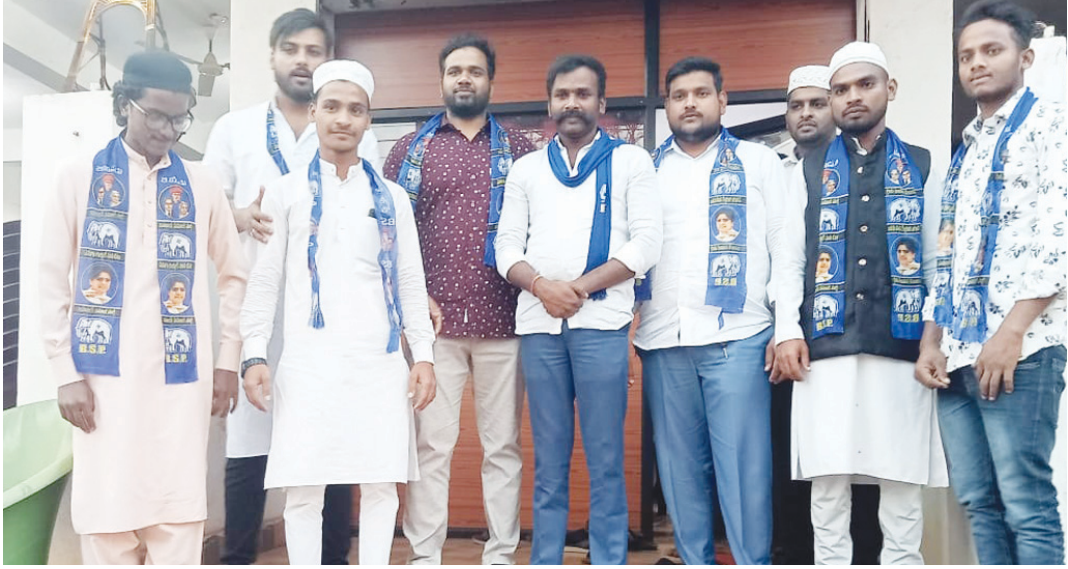
(జహీరాబాద్/శుభ తెలంగాణ/ 22డిసెంబర్) బహుజన్ సమాజ్ పార్టీ జహీరాబాద్ పార్టీ కార్యాలయంలో పలు