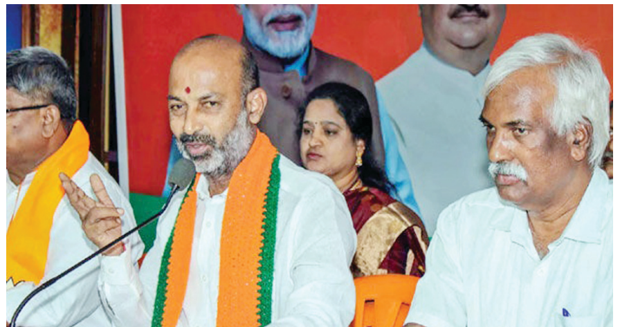
బలహీనంగా ఉన్న 45 స్థానాల్లో బలమైన అధిష్ఠానం ఆదేశించింది. ఈ స్థానాల్లో నాయకులను తీసుకొచ్చేలా చేరికల కమిటీని

హైదరాబాద్ (శుభ తెలంగాణ): వచ్చే ఎన్నికల్లో ఎలాగైనా తెలంగాణలో అధికారాన్ని కైవసం చేసుకోవాలనే పట్టుదలతో బీజేపీ ఉంది. దీనికి తగ్గట్టుగానే బీజేపీ నేతలు కూడా దూకుడు పెంచుతున్నారు. పార్టీని క్షేత్ర స్థాయి వరకు తీసుకెళ్లడానికి ప్రణాళికలు రచిస్తున్నారు. జాతీయ స్థాయి నాయకులు హైదరాబాద్ కు చేరుకుని వ్యూహాలకు పదును పెడుతున్నారు. ఏడాది పాటు తెలంగాణపై ఫుల్ ఫోకస్ పెట్టాలని బీజేపీ అధిష్ఠానం ఇప్పటికే నిర్ణయించింది. ఇందులో భాగంగా 'మిషన్ 90 తెలంగాణ 2023' పేరుతో కార్యచరణ మొదలు పెట్టింది. ఏడాది పాటు చేపట్టబోయే పార్టీ కార్యక్రమా లకు సంబంధించిన ఎన్నికల క్యాలెండర్ ను విడుదల చేయబోతోంది. రాష్ట్రంలోని 119 అసెంబ్లీ స్థానాల్లో 90 స్థానాలను కైవసం చేసుకోవడమే బీజేపీ మిషన్ లక్ష్యం. కొంచెం