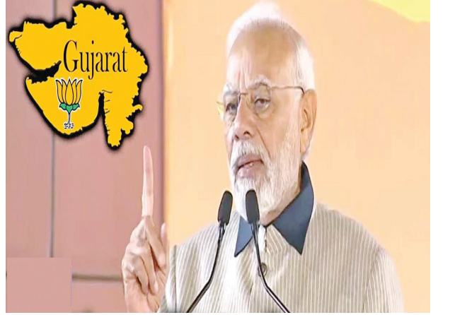
సమగ్రంగా నిర్వహించినందుకు ఎన్నికల సంఘానికి ధన్యవాదాలు తెలిపారు.

సంచలన నిర్ణయాలు, సాహసోపేత నిర్ణయాలు తీసుకునే ధైర్యం బీజేపీకి మాత్రమే ఉందని, అందుకే ప్రజలు బీజేపీ వెంట నడుస్తున్నారని చెప్పారు. “1 శాతం కంటే తక్కువ ఓట్ల తేడాతో మేం హిమాచల్ ప్రదేశ్ లో గెలిచే అవకాశాన్ని కోల్పోయాం. బీజేపీని గెలిపించేందుకు ప్రజలు ఎంతో ప్రయత్నించారని దీన్నిబట్టి తెలిసింది. ఫలితం ఎలా ఉన్నా సరే.. కేంద్ర సర్కారు నుంచి హిమాచల్ అభివృద్ధికి కృషి చేస్తాం” అని మోడీ తెలిపారు. ఎన్నికలు