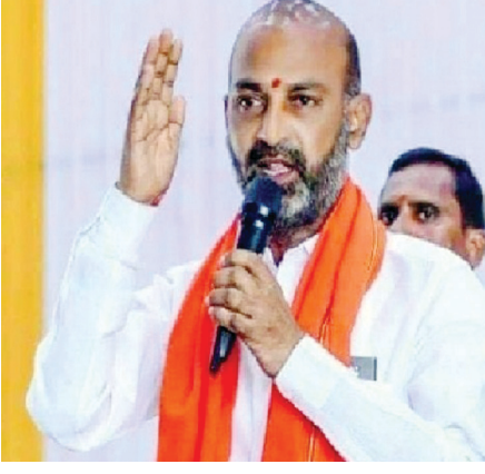
ముఖ్యమంత్రి కేసీఆర్.. ప్రజలకు సమృద్ధిగా చేశారంటూ మండిపడ్డారు. డిసెంబర్ లు రూ. 60 వేల కోట్ల సప్లయ్ ఉన్నాయని, ప్రభుత్వ కార్యాలయాల నుంచి డిసెంబర్ లకు రూ. 18 వేల కోట్ల బకాయి ఉందని తెలిపారు. రూ. 5 లక్షల కోట్ల అప్పు చేసినా

జగిత్యాల (శుభ తెలంగాణ): పేదోళ్ల అత్యుబలిదానాలతో ఏర్పడ్డ తెలంగాణలో పెద్దోడు రాజ్యమేలుతున్నాడని బీజేపీ రాష్ట్ర అధ్యక్షుడు బండి సంజయ్ విమర్శించారు. కేసీఆర్ కుటుంబం తెలంగాణ కోసం ఎలాంటి త్యాగం చేయలేదన్నారు. తెలంగాణ ఉద్యమంలో త్యాగం చేసింది పేదోళ్లు. బలిదానమైంది పేదోళ్లని చెప్పారు. ప్రజా సంగ్రామ పాదయాత్రలో భాగంగా కోరుట్ల నియోజకవర్గంలోని రాఘవపేటకు వెళ్లిన బండి సంజయ్ గ్రామంలోని బీఆర్ఎం అంబేద్కర్ విగ్రహానికి పూలమాల వేసి.. నివాళు లర్పించారు. అనంతరం రాఘవపేట గ్రామ ప్రజలను ఉద్దేశించి బండి సంజయ్ ప్రసంగించారు.