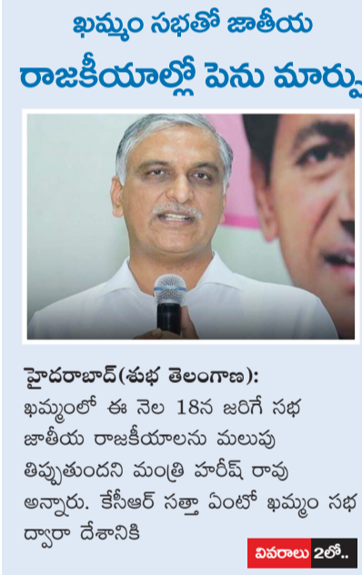
ఖమ్మం సభతో జాతీయ రాజకీయాల్లో పెను మార్పు హైదరాబాద్(శుభ తెలంగాణ): ఖమ్మంలో ఈ నెల 18న జరిగే సభ జాతీయ రాజకీయాలను మలుపు తిప్పుతుందని మంత్రి హరీష్ రావు అన్నారు. కేసీఆర్ నెత్తా ఏంటో ఖమ్మం సభ ద్వారా దేశానికి వివరాలు 2లో..

బాలింతలనూ కాపాడలేని ప్రభుత్వం హైదరాబాద్(శుభ తెలంగాణ): వైద్యం వికలించి మలక్ పేట ప్రభుత్వ ఆస్పత్రిలో ఇద్దరు బాలింతలు మృతి చెందిన ఘటన అత్యంత దారుణమని టీపీసీసీ చీఫ్ రేవంత్ రెడ్డి అన్నారు. ఇది ప్రభుత్వ నిర్లక్ష్యానికి పరాకాష్ట అని ఆరోపించారు. హైదరాబాద్ లో మల్టీ స్పెషాలిటీ ఆస్పత్రులు కరువునూ మని గొప్పలు చెప్పుకుంటున్న ప్రభుత్వం.. కనీసం బాలింతలను కూడా కాపాడలేకపోతుందని విమర్శించారు. వైద్యం విషయంలో తెలంగాణ ప్రభుత్వం నిర్లక్ష్యంగా వ్యవహరిస్తోందని, ప్రభుత్వ వివరాలు 2లో..