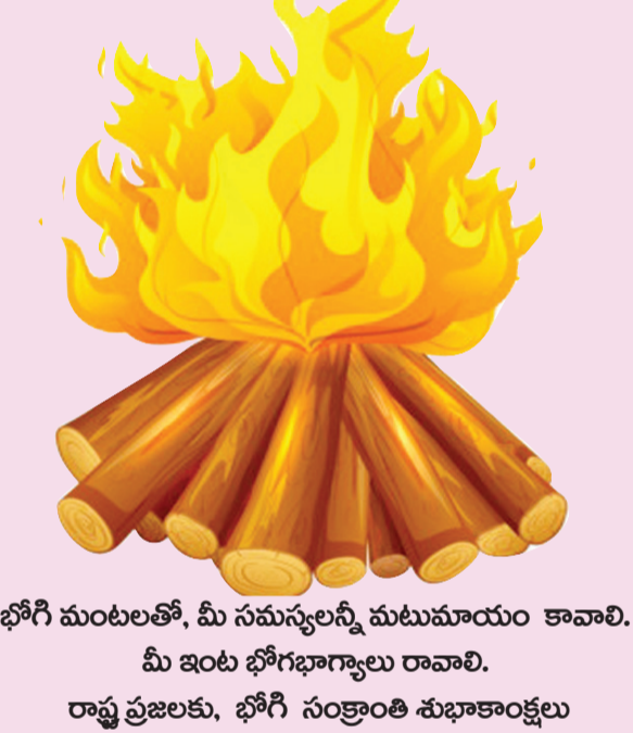
భోగి మంటలతో, మీ సమస్యలన్నీ మటుమాయం కావాలి. మీ ఇంట భోగిగూఢాగ్నాలు రావాలి. రాష్ట్ర ప్రజలకు, భోగి సంక్రాంతి శుభాకాంక్షలు

స్టార్లమ్స్ కు వెల్లువలా పెట్టుబడులు విమాత్య ఆలోచన, యోగ్యత ఉంటే చాలు ఐ.టి. పరిశ్రమలకు మంత్రి కేటీఆర్ వెల్లడి హైదరాబాద్ లో డీపీసీ సంస్థ ప్రారంభం పెట్టుబడులపై టీ పాటీతో ఒప్పందం హైదరాబాద్(శుభ తెలంగాణ): వినూత్నమైన ఆలోచన, అం దుకు తగిన యోగ్యత ఉన్న అంకుర సంస్థల కు పెట్టుబడి నిధులు లభించడం సమస్యే కాదని రాష్ట్ర ఐ.టి, పరిశ్రమల శాఖ మంత్రి కే తారకరామారావు చెప్పారు. తమ వివరాలు 2లో..