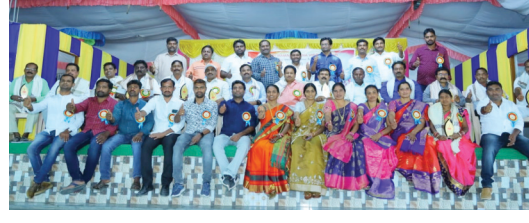
సూర్యాపేట : నూతన కల్ మండలం, విననేమిల క్రాస్ రోడ్ శ్రీ రామకృష్ణ విద్యామందిర్ స్కూల్ లో 2000-01