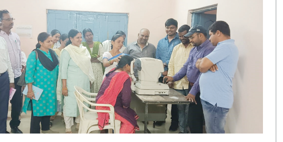
భాగస్వాములు కావాలని కోరారు. ఈ కార్యక్రమంలో గ్రామాల ప్రజాప్రతినిధులు, అధికారులు, ఆత వర్ధర్లు, పంచాయతీ కార్యదర్శులు, పాల్గొన్నారు.