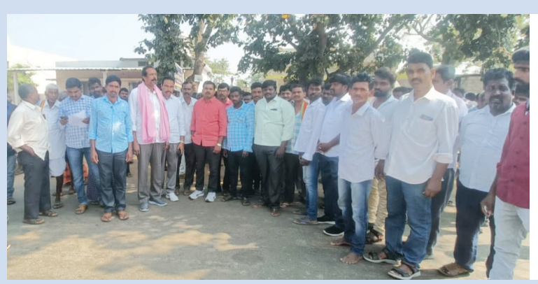
దోర్నకల్ మండలం ములక్లపల్లి గ్రామ స్థానిక సర్పంచ్ ఎంపీటీసీ గ్రామ అధ్యక్షుడు ఆధ్వర్యంలో సీఎం కేసీఆర్ ఖమ్మంలో భారీ బహిరంగ సభకు తరలి వెళుతున్న బిఆర్ఎస్ నాయకులు కార్యకర్తలు ప్రజలు