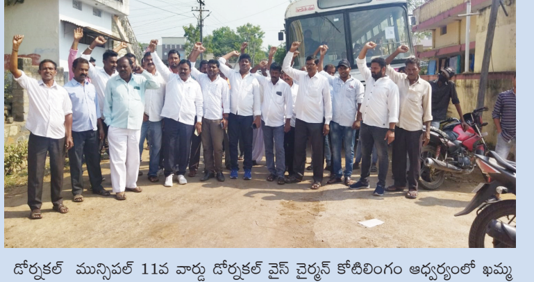
దోర్నకల్ మున్సిపల్ 11వ వార్డు దోర్నకల్ వైస్ చైర్మన్ కోటిలింగం ఆధ్వర్యంలో ఖమ్మం లో కేసీఆర్ బహిరంగ సభకు తరలి వెళుతున్న బిఆర్ఎస్ నాయకులు కార్యకర్తలు ప్రజలు