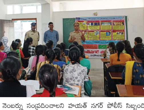
నెంబర్లు సంప్రదించాలని హయత్ సగర్ పోలీస్ సిబ్బంది

ఎల్వీసగర్ : రావకొండ కమిషనరేట్ హయత్ సగర్ పోలీస్ స్టేషన్ సిబ్బంది సైబర్ క్రైమ్ అవేర్నెస్ ప్రోగ్రామ్, హయత్ సగర్ అభ్యుస మహిళా డిగ్రీ కళాశాలలో నిర్వహించారు. ఈ కార్యక్రమానికి విద్యార్థినులు 105 మంది, కళాశాల యజమాన్యం, సిబ్బంది పాల్గొన్నారు. విద్యార్థినులకు పోలీసులు తగు నూచనలు పెట్టుబడి మోసం, లోన్ యమ్ మోసం, బహుమతి మోసం, వివాహ మోసం, ఓటిపి%డ%కేవైస్ మోసం, ఉద్యోగ మోసం, కస్టమర్ కేర్ మోసం, సోషల్ మీడియా మోసంపై తక్షణ చర్యల కోసం 1930 టోల్ ఫ్రీ