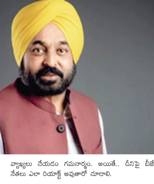
వ్యాఖ్యలు చేయడం గమనార్హం. అయితే.. దీనిపై బీజేపీ నేతలు ఎలా రియాక్ట్ అవుతారో చూడాలి.