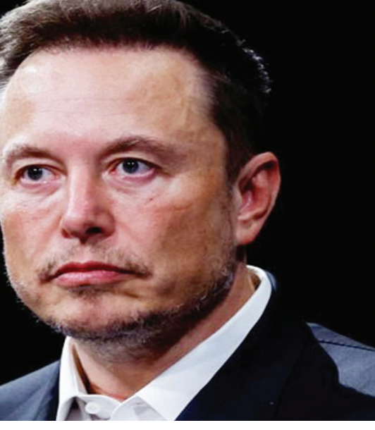
చేపడుతున్న ఈ చర్యలతో వినియోగదారులు కూడా కొంత అసంతృప్తికి గురయ్యారని అంటున్నారు. ఆ ప్రభావం కూడా యాడ్ రెవెన్యూ పై ఎఫెక్ట్ చూపించి ఉండొచ్చని పలువురు అభిప్రాయపడుతున్నారని తెలుస్తోంది!

కూడా 3 బిలియన్ డాలర్లకు కుదించారని తెలుస్తుంది. అయితే 2021లో 5.1 బిలియన్ డాలర్లతో పోలిస్తే ఇది చాలా తక్కువ అని తెలుస్తుంది. అయితే... ట్విట్టర్ ను ఆధీనంలోకి తీసుకున్నప్పటినుంచి మస్క్ కొన్ని కొన్ని కడింగ్ చర్యలు చేపట్టారని అంటున్నారు. అయినప్పటిని అవేమీ సత్ఫలితాలు ఇవ్వలేదని తెలుస్తుంది. ఇదే సమయంలో భారీ సంఖ్యలో ఉద్యోగులను కూడా తొలగించారు. ఇలా ఎన్ని రకాల ప్రయత్నాలు చేసినా ట్విట్టర్ ఆదాయం పెరగలేదని తెలుస్తుంది. అయితే యాడ్ రెవెన్యూ పడిపోవడానికి ఈ మధ్య కాలంలో ఎలాన్ మస్క్ తీసుకున్న కొన్ని నిర్ణయాలు కూడా కారణం అని కొంతమంది పరిశీలకుల అభిప్రాయం అని తెలుస్తుంది. ఇందులో భాగంగా... ఇప్పటికే బ్లా టీకీ సబ్ స్క్రిప్షన్ పేరిట నిబంధనలు పెట్టిన మస్క్.. ఎక్కువ మంది వెరిఫై అకౌంట్లు తీసుకునేలా సరికొత్త ప్లాన్ చేసిన సంగతి తెలిసిందే. ఇదే సమయంలో... పోస్టులను చూసేందుకు లిమిట్ సెట్ చేసిన మస్క్.. ఒక రోజులో ఎవరు ఎన్ని పోస్టులను చదవవచ్చనే దానిపై తాత్కాలిక పరిమితులను అమలు చేస్తున్నట్లు ప్రకటించారు కూడా. ఇలా ట్విట్టర్ ను ఒక ప్రయోగశాలగా చేసి