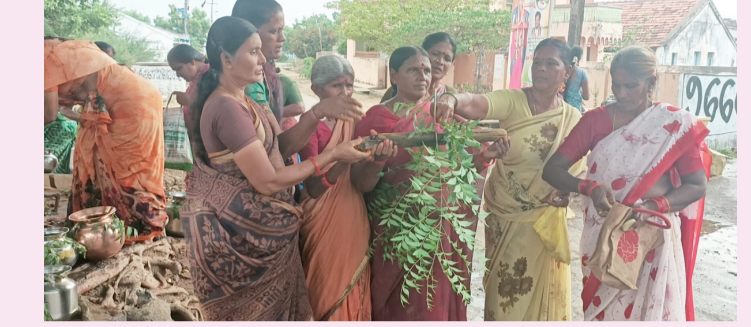
వారంవారం వారంవారం ఒకసారి రావా... మహిళలు గ్రామ దేవతలకు జలాభిషేకం, పూజలు