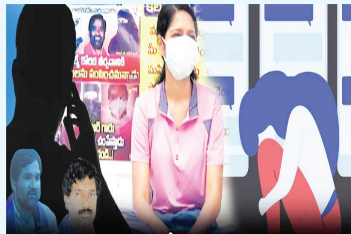
హైదరాబాద్(శుభ తెలంగాణ): లైంగిక వేధింపులు పెరిగిపోయా యి. బంగారు తెలంగాణలో మహిళలకు ముఖ్యంగా అధికార పార్టీ ఎమ్మెల్యేలే రక్షణ కరువైంది. ప్రజాప్రతి నిధులు, లైంగిక వేధింపులు ఎదుర్కొనే వారిలో బెత్తాపాక పారిశ్రా మిక వేతలకు ఎక్కువగా ఉంటు న్నారు.

తాజాగా హైదరాబాద్ లో ఎమ్మెల్యేపై కార్పొరేటర్ ఫిర్యాదు