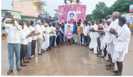
శాఖలలో అర్హతలను బట్టి పునరుద్ధరిస్తూ వారికి పర్మనెంట్ పే స్కేల్ తో జీవో చేశారు. కార్యక్రమంలో వీఆర్ఎం ల జె వి సి నాయకులు వీఆర్ఎంల తదితర పాల్గొన్నారు.

ఉభ తెలంగాణ :: కామారెడ్డి జిల్లా పట్టణ మండల కేంద్రంలోని సోమవారం నాడు సీఎం కల్వకుంట్ల చంద్రశేఖర రావు చిత్రపటానికి వీఆర్ఎం జెసి తరపున పాలాభిషేకం చేసి పండగ చేసుకున్నారు అనంతరం సీఎం కేసీఆర్ కు ధన్యవాదాలు తెలియజేస్తూ పండగ వాతావరణం లో మునిగారు. వివరాల్లోకి వెళితే వీఆర్ఎం వ్యవస్థను పర్మనెంట్ గా రద్దు చేస్తూ వారి ఉద్యోగాలను పే స్కేల్ అమలు చేస్తూ పర్మనెంట్ చేస్తూ జీవో జారీ చేశారు. నీరదీ ముస్సూర్ లస్కర్ వంటి కాలం చెల్లిన పేదలతో పలువందల భూస్వామ్య వ్యవస్థకు చిన్నాహాళుగా మిగిలిన వీఆర్ఎం వ్యవస్థను శాశ్వతంగా రద్దు చేస్తూ ముఖ్యమంత్రి చంద్రశేఖర రావు చారిత్రాత్మక నిర్ణయం తీసుకున్నారు. వీఆర్ఎంలను ఇతర