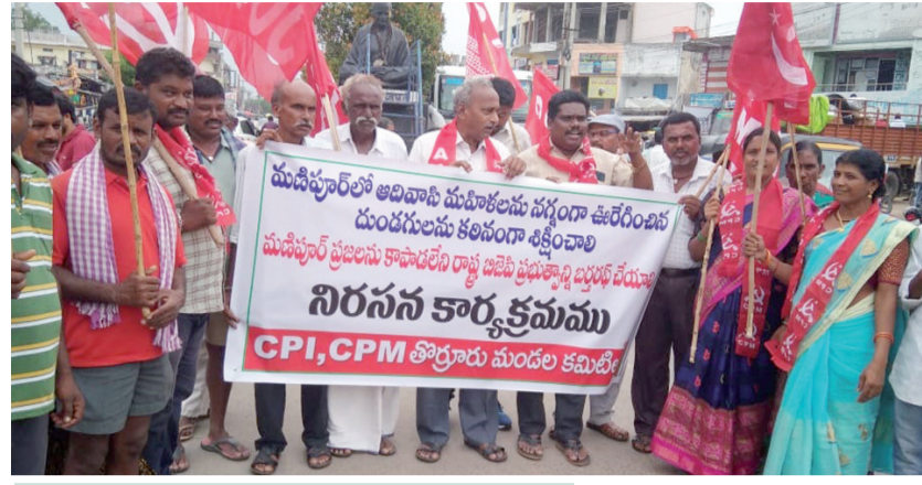
● మణిపూర్ రాష్ట్ర ప్రభుత్వాన్ని వెంటనే రద్దు చేయాలి. ● సిపిఐ, సిపిఎం పార్టీల డిమాండ్.