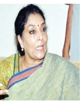
ఆకాశమంత ఉంటారని, కానీ కొందరికే అవకాశాలు వస్తాయని రేణుకా చౌదరి అన్నారు. “ఈటల గారు కూడా వస్తున్నారా? అవునా.. అది రూపాంశ ఇప్పుడు. తర్వాతి చాప్టర్? వస్తే బానే ఉంటుంది. ఇంకెవరు వస్తున్నారా?

హైదరాబాద్ (ఉభయ తెలంగాణ): కేంద్ర మాజీ మంత్రి రేణుకా చౌదరి ఆసక్తికర వ్యాఖ్యలు చేశారు. కాంగ్రెస్ లో చేరికలపై అధిష్టానం నిర్ణయమే ఫైనల్ అని స్పష్టం చేశారు. అధిష్టానం అంగీకరించిన వాళ్ళందరూ పార్టీలోకి వస్తారని, ఎవరు పార్టీలోకి వచ్చినా తాను ఆహ్వానిస్తానని చెప్పారు. హుజూరాబాద్ ఎమ్మెల్యే ఈటల రాజేందర్ చేరితే బాగుంటుందని అన్నారు. పాంగులేటి రాకను తాను వ్యతిరేకించలేదని చెప్పారు. తాజా భేటీలో తమ మధ్య సీట్ల కేటాయింపు విషయంలో ఏలాంటి చర్చ జరగలేదని, సీట్ల విషయంలో ఆయన ఏ డిమాండ్ చేయలేదని తెలిపారు. కాంగ్రెస్ లో ఆశించేవారు