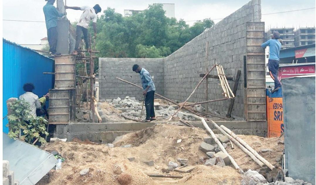
శుభ తెలంగాణ :కొంపల్లి మున్సిపాలిటీలో అనుమతులు లేని నిర్మాణాలు అక్రమ నిర్మాణాలు గట్టి గట్టికి దర్శనం ఇస్తున్నాయి.వీటి అన్నింటినీ ఉన్నత మున్సిపాలిటీ భావన నిర్మాణ అధికారులు చూసి చూడనట్లుగా