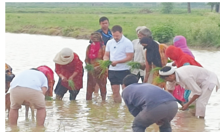
హైదరాబాద్ (శుభ తెలంగాణ): సామాన్య కష్టాలను తెలుసుకునేందుకు జనంలోకి వెళుతున్న కాంగ్రెస్ పార్టీ మాజీ అధ్యక్షుడు రాపూల్ గాంధీ ఈసారి రైతులను కలుసుకున్నారు. పొలంలో పనిచేస్తున్న