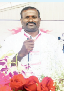
%డినా% పార్టీ ఇర్విన్