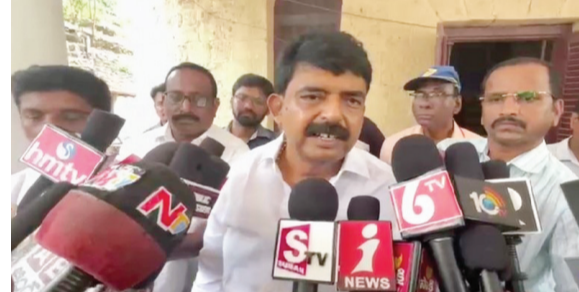
వైయస్ జగన్ మీద బురదజల్లడం, చంద్రబాబుకు మేలు జరగాలని చూడటం

హైదరాబాద్ (శుభ తెలంగాణ): తాడిచెట్ల ఎంపీ కెకావ్ అంటే దూడ గడ్డికోసం అన్నట్లుగా పవన్ కల్యాణ్ మాటలు ఉన్నాయని, చంద్రబాబు కోసమే పనిచేస్తానని దమ్ముంటే షమ్షేర్గా చెప్పాచ్చు కదా అని పవన్ ను వైయస్ఆర్ సీపీ ఎమ్మెల్యే మాజీ మంత్రి పిల్లనాని ప్రశ్నించారు. వారూ యాత్ర పేరుతో నోటికొచ్చినట్లు ఏదో ఒకటి మాట్లాడటం, ప్రజలను రెచ్చగొట్టడం, సీఎం