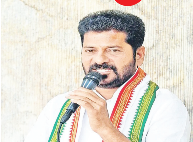
అధికారంలోకి వచ్చేది కాంగ్రెస్సేనని, నెలకు రూ.4 వేల పెన్షన్ పథకాన్ని అమలు చేసే తీరుతుందని ప్రకటించారు. తెలంగాణ వస్తే బతుకులు బాగుపడతాయన్న కేసీఆర్.. వచ్చాక పేదల సంక్షేమాన్ని మరిచారన్నారు. దళితులకు భూములు పంచింది, ఇందిరమ్మ ఇళ్లు ఇచ్చింది కాంగ్రెస్ హయాంలోనేనని గుర్తు చేశారు. రాష్ట్ర సంచలన కేసీఆర్ తన కుటుంబ సభ్యులకు దోచిపెడుతున్నారని, వివరాలు 2లో..

అన్నదాతలకు అన్యాయం.. పంటలకు గిట్టుబాటు ధర కల్పించడం లేదు: రేపంత్ మేం రాగానే రూ.2 లక్షల రుణమాఫీ 4 వేల పెన్షన్.. 2లక్షల ఉద్యోగాలు కేసీఆర్ పాలనపై తిరగబడదాం కాంగ్రెస్లోకి చేవెళ్ల బీఆర్ఎస్ నేతలు హైదరాబాద్(శుభ తెలంగాణ): కేసీఆర్ ముఖ్యమంత్రి అయ్యాక తెలంగాణ రాష్ట్రంలో 88 వేల మంది రైతులు చనిపోయారని టీకీసీసీ అధ్యక్షుడు రేపంత్ రెడ్డి అన్నారు. ఆరుగాలం శ్రమించి రైతు పండించిన పంటకు గిట్టుబాటు ధర కూడా కల్పించని పరిస్థితి నెలకొందిన్నారని. మంగళవారం చేవెళ్ల నియోజకవర్గం శంకర్పల్లికి వెందిన పలువురు బీఆర్ఎస్ నేతలు, కార్యకర్తలు రేపంత్ రెడ్డి నివాసంలో ఆయన సమక్షంలో కాంగ్రెస్ పార్టీలో చేరాడు. ఈ సందర్భంగా రేపంత్ మాట్లాడుతూ.. వచ్చే ఎన్నికల్లో గెలిచేది,