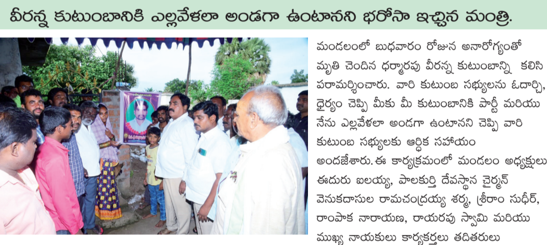
శుభ తెలంగాణ :పాలకుర్తి నియోజకవర్గం పెద్దవంగర పాల్గొన్నారు..