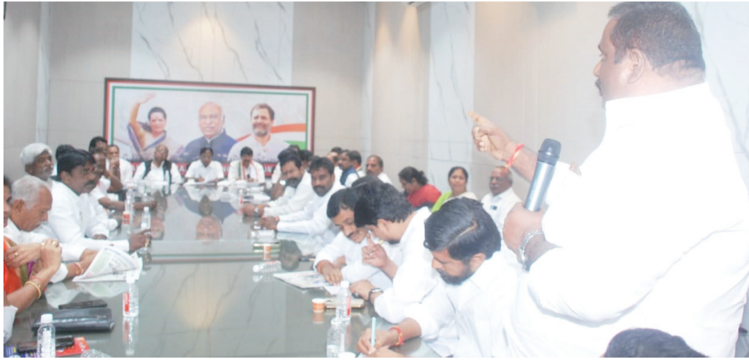
కార్మిక నాయకునిగా ఇప్పటివరకు చట్టసభలో కాలు పెట్టని బీసీ బిడ్డగా ( వడ్డరి) అవకాశం ఇవ్వమని డివీసీసీని ఏ బి సి సి ని సోనియా గాంధీ రాహుల్ గాంధీ రేవంత్ రెడ్డి ని కోరుకుంటున్నాను బీసీలను ఓటు బ్యాంకుగా చూడొద్దని