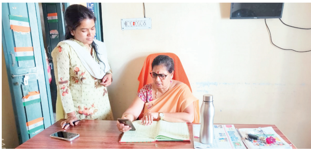
చెత్త పాయింట్లు, వ్యర్థ రవాణా వాహనాలు, మెటీరియల్ రికవరీ సౌకర్యాలు, సంతృప్త వంటి అన్ని పారిశుధ్య అనువులను ట్రాండింగ్ చేయడం వంటి కార్యకలాపాలు ఉంటాయి. గ్రామంలో చెత్తాచెదారం లేకుండా చూసుకోవాలన్నారు.