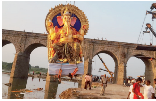
భక్తజనం నిమజ్జనంలో పాల్గొన్నారు. మున్నేరు వాగు జనసంద్రంలో పోలికొంది.