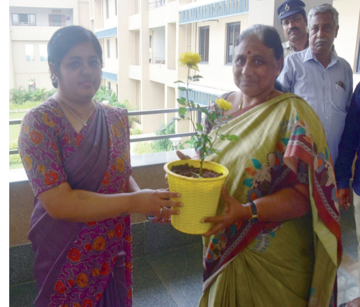
రంగారెడ్డి జిల్లా శుభ తెలంగాణ : రాష్ట్ర శాసనసభ ఎన్నికలను పురస్కరించుకుని సమీకృత జిల్లా కార్యాలయాల సముదాయం (కలెక్టరేట్)లోని రూమ్ నెం. 15లో ఏర్పాటు చేసిన మీడియా సెంటర్, మీడియా సర్కికివెన్ అండ్