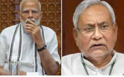
తెలుస్తోంది. నీతి ఆయోగ్ మీటింగ్ నుంచి వాకౌట్ చేసిన పశ్చిమబెంగాల్ సీఎం ఈ సమావేశంలో ఊహించని పరిణామం చోటు చేసుకుంది. సమావేశం నుంచి పశ్చిమ బెంగాల్ ముఖ్యమంత్రి మమతా బెనర్జీ వాకౌట్ చేశారు. ఈ సమావేశంలో బెంగాల్ కు కేంద్ర నిధులు నిరాకరించిన అంశాన్ని ప్రస్తావించగా.. తన మైక్ ను మ్యూట్ చేసినట్లు దీని ఆరోపించారు. ఐదు నిమిషాలకు మించి మాట్లాడేందుకు అనుమతించలేదని ఆగ్రహం వ్యక్తం చేశారు. అందుకే భేటీ నుంచి వాకౌట్ చేసినట్లు తెలిపారు. 'నాకు ఐదు నిమిషాలు మాత్రమే మాట్లాడేందుకు అనుమతించారు. పశ్చిమ బెంగాల్ కు కేంద్రం నిధులు ఇవ్వడం లేదని సమావేశంలో ప్రస్తావించాను. అంతే నామైక్ ను మ్యూట్ చేసేసారు. నాకంటే ముందు చాలా మంది