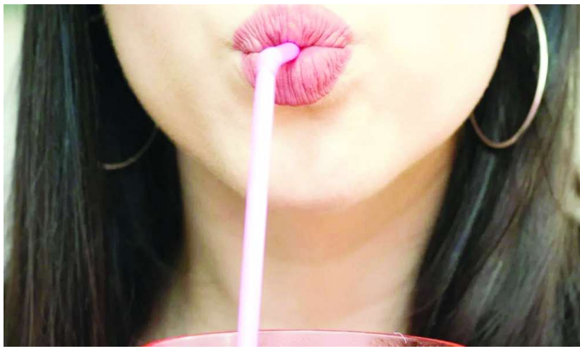
అక్కడి నుంచి కడుపులోకి ప్రవేశించి ప్రతిరోజూ కొద్దికొద్దిగా రక్తంలో కలిసిపోతాయి. భవిష్యత్తులో ఇది ఏదైనా తీవ్రమైన వ్యాధికి కారణం కావచ్చు. ఈ కారణంగానే నీటిని నిల్వ చేయడానికి ప్లాస్టిక్ బాటిళ్ల వాడకాన్ని తగ్గించాలని నిపుణులు సిఫార్సు చేస్తున్నారు.

కొబ్బరి నీళ్లు, జ్యూస్, శీతల పానీయాలు.. ఏదైనా సరే స్ట్రాతో తాగితే ఈ మజానే వేరు. కోవిడ్ తర్వాత చాలా మంది బయటకు రెస్టారెంట్లకు వెళ్లి ఏదైనా తాగవల్సి వస్తే.. తప్పనిసరిగా స్ట్రా ద్వారా తాగుతున్నారు. మీరు అవలంబిస్తున్న ఈ పద్ధతి అస్సలు ఆరోగ్యానికి మంచిదేనా? అనే విషయం ఎప్పుడైనా ఆలోచించారా? ప్రతిరోజూ ఈ విధంగా స్ట్రా ఉపయోగించడం వల్ల మీకు తెలియకుండానే మీ శరీరానికి హాని కలుగుతోందంటున్నారు ఆరోగ్య నిపుణులు. స్ట్రా ద్వారా పానీయాలు తీసుకోవడం వల్ల గ్యాస్ట్రిక్ సమస్యలు పెరుగుతాయి. నిజానికి స్ట్రా ద్వారా తాగినప్పుడు, కడుపులోని అదనపు గాలి వెళ్లిపోతుంది. ఫలితంగా గ్యాస్ట్రిక్ సమస్యలు ఉన్నవారికి గ్యాస్ట్రిక్ సమస్య మరింత తీవ్రతరం అవుతుంది. జీర్ణ సమస్యలు కూడా రావచ్చు. స్ట్రా ఉపయోగించడం వల్ల, దాని ప్రభావం చర్మంపై కూడా పడుతుంది. నోటి కండరాలు త్రాగిన ప్రతిసారీ అదనపు ఒత్తిడికి లోనవుతాయి. ఈ ఒత్తిడి క్రమం తప్పకుండా కొనసాగితే ముఖంపై ముడతలు ఏర్పడతాయి. మీ వయస్సు ఎంతైనా.. చిన్న తనంలోనే పెద్దవారిగా కనిపిస్తారు. కంటైనర్ నోటితో తాగడం వల్ల ప్రతి సిస్ట్ దంతాలు, నోటిలో ఉండే బ్యాక్టీరియా పెరగకుండా ఎప్పుడీకప్పుడు శుభ్రం అవుతుంది. అదే.. స్ట్రా ద్వారా తీసి లేదా శీతల పానీయాలను క్రమం తప్పకుండా తీసుకోవడం నోటి కుహరంపై ప్రభావం చూపుతుంది. దంతాలు, నోటి లోపల కొన్ని ప్రదేశాలలో చక్కెర పేరుకుపోవడం వల్ల కొంత కాలం తర్వాత దంత క్షయం సంభవించవచ్చు. నోటి కాలంలో పేపర్ స్ట్రాలు చాలా తక్కువ ఉపయోగిస్తున్నారు. చాలా చోట్ల ప్లాస్టిక్ స్ట్రానే వాడుతారు. తత్ఫలితంగా వీటి ద్వారా పానీయాలు సేవించేటప్పుడు ప్లాస్టిక్లోని సూక్ష్మ కణాలు పానీయంలో కలిసి ప్రమాదం ఉంది. ఇది చాలా ప్రమాదకరమైనది. ప్లాస్టిక్లోని అతి చిన్న కణాలు శరీరంలోకి ప్రవేశించి..