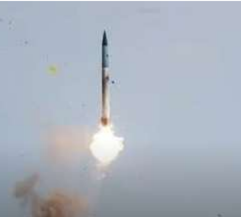
పేర్కొన్నాయి. ఈ కనరత్తులో ఎస్-400 ఎయిర్ డిఫెన్స్ మిసైల్ సిస్టమ్ భారత వైమానిక దళ వ్యవస్థతో సంపూర్ణంగా

రష్యా నుంచి భారత్ కొనుగోలు చేసిన సుదర్శన్ ఎస్-400 ఎయిర్ డిఫెన్స్ క్షిపణి వ్యవస్థ పనితీరు అమోఘం అనిపిస్తోంది. ఇండియన్ ఎయిర్ ఫోర్స్ (ఐఎఎఫ్) కనరత్తులో ఎస్-400 భారీ విజయాన్ని సమోదా చేసింది. శత్రువు పైటర్ ఎయిర్ క్రాఫ్ట్ స్వాకేజీలో ఏకంగా 80 శాతం విమానాలను కూల్చివేసింది. ప్యాకేజీలోని మిగతా విమానాలను సైతం విజయవంతంగా వెనక్కి తరిమికొట్టింది. మొత్తంగా శత్రువు తన మిషన్ ను నిలిపివేసేలా ఎస్-400 సమర్థవంతంగా పనిచేసింది. తన అమ్ములపాదిలోని లాంగ్-రేంజ్ ఎయిర్ డిఫెన్స్ మిసైల్ సిస్టమ్ ను మోహరించి ఈ ప్రయోగాన్ని చేపట్టినట్లు ఇండియన్ ఎయిర్ ఫోర్స్ వర్గాలు వెల్లడించాయి. వాయు సేనలో ఎయిర్ డిఫెన్స్ మిసైల్ సిస్టమ్ సంపూర్ణ సకీకరణను చాటిచెప్పడమే లక్ష్యంగా ఎయిర్ ఫోర్స్ ఈ కనరత్తు నిర్వహించినట్లు సంబంధిత వర్గాలు వివరించాయి. ఎస్-400 ఆయుధ వ్యవస్థ సామర్థ్యాన్ని పరీక్షించేందుకు నిజమైన యుద్ధ విమానాలను ఉపయోగించినట్లు