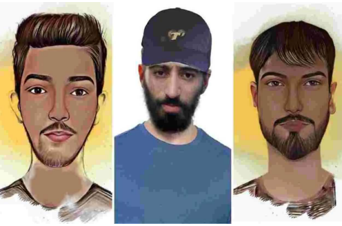
వివరాలను అత్యంత గోప్యంగా ఉంచుతామని తెలిపారు. సమాచారం ఇవ్వాలిస్తే ఫోన్ నెంబర్లను కూడా పోలీసులు ప్రకటించారు. -ఎస్ఎస్పి దోడా-9541904201 -ఎస్పీ హెచ్కౌత్ ఆర్ఎస్ దోడా-9797649362, 9541904202

శ్రీసగర్: జమ్మూ ప్రాంతంలోని దోడా జిల్లాలో జూన్ నుంచి పలు ఉగ్రవాద ఘటనలు చోటుచేసుకోవడం, కొండప్రాంతం జిల్లాలో తిరిగి తీవ్రవాదాన్ని పునరుద్ధరించేందుకు పాక్ ప్రేరేపిత ఉగ్రవాదులు చేస్తున్న దుష్కృత్యాలపై జమ్మూ కశ్మీర్ పోలీసులు మరంత అప్రమత్తమయ్యాయి. టెర్రరిజంపై కొరడా ఝుళిపిస్తూ ముగ్గురు ఉగ్రవాదుల స్పెషల్ ను శనివారంనాడు విడుదల చేశారు. వీరి ఆచూకీ చెప్పిన వారికి రూ.5 లక్షల చొప్పున రివార్డును ప్రకటించారు. ఈ ఉగ్రవాదులు దోడా, దెస్సా ప్రాంతంలోని కొండ ప్రాంతాల్లో సంచరిస్తూ ఇటీవల దెస్సాలోని ఉర్ర బగి ప్రాంతంలో జరిగిన ఉగ్రఘటనల్లో కీలక పాత్ర పోషించినట్లు పోలీసులు అనుమానిస్తున్నారు. సమాచారం ఇలా ఇవ్వండి... ముగ్గురు ఉగ్రవాదుల కదలికలపై సమాచారం తెలిస్తే ప్రజలు వెంటనే తమకు సమాచారం ఇవ్వాలని జమ్మూకశ్మీర్ పోలీసులు (దోడా జిల్లా) కోరారు. సమాచారం ఇచ్చిన వారి