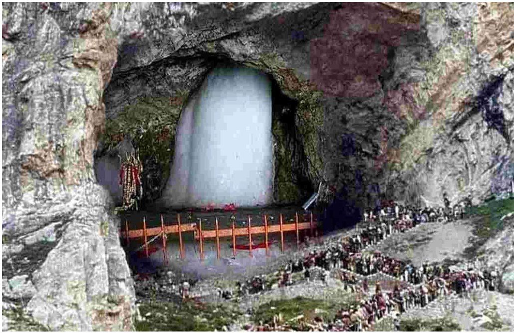
అప్రమత్తమైన భారత బలగాలు అమర్నాథ్ యాత్రకు పటిష్ట బందోబస్తును ఏర్పాటు చేసేందుకు సిద్ధమయ్యారు. జమ్మూ కశ్మీర్ లోని అనంతనాగ్ జిల్లాలో అమర్నాథ్ గుహలో సహజసిద్ధంగా ఏర్పడే మంచు లింగాన్ని దర్శించుకునేందుకు ఏటా దేశ నలుమూలల నుంచి లక్షల సంఖ్యలో భక్తులు తరలి వస్తుంటారు. ఈ ఏడాది జూన్ 29న యాత్ర ప్రారంభమైనప్పటి నుంచి ఇప్పటి వరకూ 4 లక్షలకుపైగా భక్తులు దేశ విదేశాల నుంచి వచ్చి స్వామి వారిని దర్శించుకున్నారు.

కశ్మీర్ లోకి చొరబడ్డ ఉగ్రవాదులు? దేశంలోని వివిధ ప్రాంతాల్లో విధ్వంసం సృష్టించడానికి పాకిస్థాన్ నుంచి ఏడుగురు ఉగ్రవాదులు కశ్మీర్ లోని ప్రవేశించారని ఇంటెలిజెన్స్ వర్గాలు అనుమానిస్తున్నాయి. ఈ క్రమంలోనే పతాన్ కోట్ సమీపంలోని ఓ గ్రామంలో అధునాతన ఆయుధాలతో అనుమానిత ఉగ్రవాదుల కదలికలను గుర్తించాయి. జమ్మూ ప్రాంతంలో గత కొన్ని రోజులుగా భద్రతా బలగాలపై జరుగుతున్న దాడుల వెనుక పాకిస్థాన్ కుట్ర ఉన్నట్లు సైనికులు అనుమానిస్తున్నారు. అధికారులు అప్రమత్తమై ఆ ప్రాంతంలో సెర్చ్ ఆపరేషన్ కొనసాగిస్తున్నారు. ఉగ్ర కుట్రల హెచ్చరికల నేపథ్యంలో