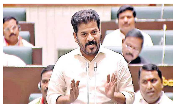
హైదరాబాద్, శుభ తెలంగాణ

లేదంటే డిస్కంలపై కేంద్రం చర్యలు.. విద్యుత్తు శాఖకు విధిలేని పరిస్థితి