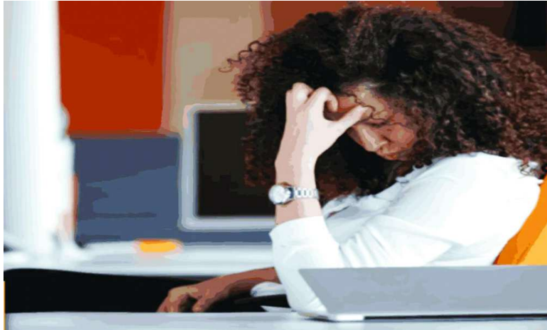
కారణమవుతుందని వైద్యులు చెబుతున్నారు. నిద్రపోతున్నప్పుడు ఎక్కువగా చెమటలు పడుతూ ఉంటే మీ కొలెస్ట్రాల్ లెవల్స్ ఎప్పటికప్పుడు చెక్ చేసుకోవడం మంచిది. కొలెస్ట్రాల్ స్థాయి పెరిగినప్పుడు రక్త నాళాలు కూడా ప్రభావితమవుతాయి. కొలెస్ట్రాల్ గుండెకు రక్తాన్ని సరఫరా చేసే ధమనులలో నిక్షిప్తం చేయబడి, రక్త ప్రవాహాన్ని ప్రభావితం చేస్తుంది.

శరీరంలో చెడు కొలెస్ట్రాల్ స్థాయి పెరిగితే దాని లక్షణాలు కనిపించవు. కానీ శరీరంలో మార్పులు లేదా కొన్ని సమస్యలే దీని లక్షణాలు అంటున్నారు నిపుణులు. మహిళలు 40 ఏళ్ల తర్వాత అధిక కొలెస్ట్రాల్తో సమస్యలను ఎదుర్కొంటారు. కొలెస్ట్రాల్ స్థితి రూపంలో ధమనులలో జమ అవుతుంది. ముఖ్యంగా 40 ఏళ్ల తర్వాత మహిళలు ప్రత్యేక శ్రద్ధ తీసుకోవాలి. ఎందుకంటే ఈ సమయంలో మహిళలు ఒత్తిడితో పాటు అనేక శారీరక మార్పులకు గురవుతుంటారు. మెనోపాజ్, కండరాల మార్పులు, మానసిక స్థితి ఇలా అనేక మార్పులు జరుగుతాయి. ఇవన్నీ శరీరాన్ని ప్రభావితం చేస్తాయి. ఇలాంటి పరిస్థితిలో శరీరంలో కొలెస్ట్రాల్ స్థాయి పెరిగితే ఈ క్రింది లక్షణాలు కనిపించడం ప్రారంభిస్తాయి. చాలా సార్లు కొలెస్ట్రాల్ స్థాయి పెరిగినప్పుడు దాని ప్రభావం కళ్లపై కూడా కనిపిస్తుంది. కొలెస్ట్రాల్ కారణంగా దృష్టి మసకబారవచ్చు లేదా దృష్టి క్రమంగా తగ్గిపోయి పూర్తిగా అదృశ్యం కావచ్చు. అందువల్ల కంటి చికాకు, ఎరుపు, అలసట వంటి సందర్భాల్లో వైద్యుడిని సంప్రదించడం చాలా ముఖ్యం. అధిక కొలెస్ట్రాల్ అత్యంత సాధారణ లక్షణం కాళ్ళలో నొప్పి. కాళ్ల నొప్పికి ప్రధాన కారణం కొలెస్ట్రాల్ కారణంగా కాళ్లలో రక్తనాళాలు అడ్డుపడటం లేదా కుంచించుకోవడం. ఇటువంటి పరిస్థితిలో మహిళలు నడిచేటప్పుడు లేదా శారీరక శ్రమ చేసినప్పుడు వారి కాళ్ళలో నొప్పి ప్రారంభమవుతుంది. సాధారణ నడకతో కూడా కాళ్ల నొప్పి సమస్య మొదలవుతుంది. కొలెస్ట్రాల్ పెరగడం వల్ల కొందరికి బాగా చెమట పట్టడం మొదలవుతుంది. మొత్తం శరీరానికి ఆక్సిజన్ సరిగ్గా అందకపోవడం వల్ల ఇది జరుగుతుంది. ఆక్సిజన్ లేకపోవడానికి కారణం రక్త ప్రసరణలో అవరోధం. చెడు కొలెస్ట్రాల్ పెరుగుదల అనేక రక్త నాళాలలో అడ్డంకి