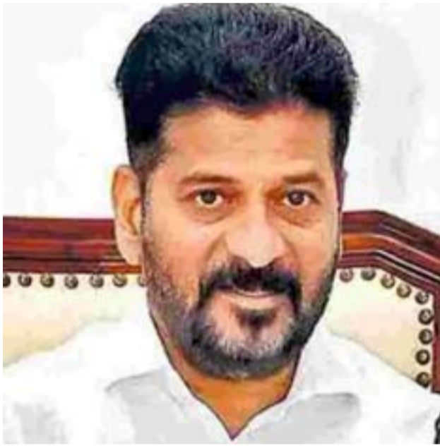
శుభ తెలంగాణ ఢిల్లీ

ఓలింపిక్స్, ఆసియన్, కామన్వెల్త్ గేమ్స్ వంటి జాతీయ, అంతర్జాతీయ క్రీడలు తెలంగాణ రాష్ట్రంలో నిర్వహించేలా చర్యలు తీసుకోవాలని కేంద్ర క్రీడల శాఖ మంత్రి మనుసుఖ్ మాండవీయను ముఖ్యమంత్రి రేవంత్ రెడ్డి కోరారు. ఖేలో