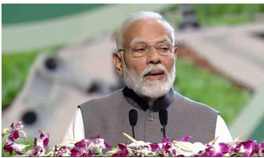
పాలు, పప్పు దినుసులు, మసాలాలు ఉత్పత్తి చేయడంలో భారత్ నెంబర్ వన్ గా ఉందన్నారు. ఆహారధాన్యాలు, పండ్లు, కూరగాయలు, దూది, చక్కెర, టీ పొడి ఉత్పత్తిలో ఇండియా

న్యూఢిల్లీ: భారత్ లో ఆహార నిల్వలు సమృద్ధిగా ఉన్నట్లు ప్రధాని మోదీ తెలిపారు. ఇక ప్రపంచవ్యాప్తంగా ఉన్న ఆహార, పోషకాంశ భద్రతకు పరిష్కారాలు చూపేందుకు భారత్ పనిచేస్తున్నట్లు ఆయన వెల్లడించారు. 65 ఏళ్ల తర్వాత ఇండియాలో నిర్వహిస్తున్న ఇంటర్నేషనల్ కాన్ఫరెన్స్ ఆఫ్ అగ్రికల్చరల్ ఎకానమిస్ట్స్ సదస్సులో ఆయన మాట్లాడారు. సమగ్ర వ్యవసాయ విధానంపై 2024-25 కేంద్ర బడ్జెట్లో ఫోకస్ పెట్టినట్లు ప్రధాని మోదీ తెలిపారు. గతంలో ఇండియాలో ఈ సమావేశాన్ని నిర్వహించినప్పుడు, అప్పుడే భారత్ స్వతంత్ర్యాన్ని సాధించింది, ఆ సమయంలో దేశం వ్యవసాయ, ఆహార భద్రత సవాళ్లను ఎదుర్కొన్నదన్నారు. ఇప్పుడు భారత్ ఆహార మిగులు దేశంగా మారిందన్నారు.