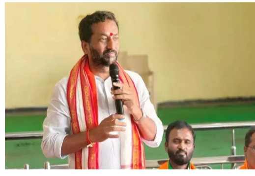
ఎవరికీ వత్తాను వలకను.... దేశం కోసం ధర్మం కోసం మాట్లాడతా నని అన్నారు. తెలుగు భాష గురించి అమెరికా లో మాట్లాడుతుంటారు... ఈయనకు ఎలాగో

వికారాబాద్, శుభ తెలంగాణ : వికారాబాద్ జిల్లా కేంద్రంలో బీజేపీ సభ్యత్వం సమోదా కార్యక్రమానికి బీజేపీ ఎంపీ రఘునందన్ రావు హాజరయ్యారు. రఘునందన్ రావు మాట్లాడుతూ ప్రతి కార్యక్రమం గుర్తించి గౌరవించే పార్టీ భారతీయ జనతా పార్టీ మాత్రమే. పూర్తి ప్రజాస్వామ్య బద్ధంగా పార్టీ ఎన్నికలు నిర్వహిస్తున్న ఏకైక పార్టీ కూడా బీజేపీ నే. తెలంగాణలో రానున్న రోజుల్లో అధికారంలోకి వచ్చే అవకాశాలు ఉన్న పార్టీ బీజేపీ. తెలంగాణ రాష్ట్రంలో అధికార పార్టీకి ఎన్ని సీట్లు వచ్చాయో బీజేపీ కీ సైతం అన్నే సీట్లు వచ్చాయి. వికారాబాద్ జిల్లా గురించి గతంలో ఉన్న నాయకులు అనేక మాటలు మాట్లాడినా అవి అవి ప్రాంతం చేయలే. రఘునందన్ ప్రాణా గురించి మాట్లాడితే రేపంత్ రెడ్డి కి సపోర్ట్ చేస్తుందని సన్నాయి నొక్కులు నొక్కుతూ ప్రజల నేను