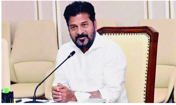
ఈ నేపథ్యంలో రుణాల సమస్యను పరిష్కరించేందుకు తమకు తగిన సహాయం, మద్దతు ఇవ్వాలని కోరారు. రుణాన్ని రీ ప్ర్యక్టర్ చేసే అవకాశం ఇవ్వాలని లేదా అదనపు ఆర్థిక సహాయం అందించాలన్నారు. కేంద్ర పన్నుల్లో రాష్ట్రాలకు పంపిణీ చేసే నిధుల వాటాను 41

గత ఆర్థిక సంవత్సరం చివరి నాటికి రుణ భారం రూ. 6.85 లక్షల కోట్లకు చేరుకుందన్నారు. ఇందులో బడ్జెట్ రుణాలతో పాటు ఆఫ్-బడ్జెట్ రుణాలు ఉన్నాయని సీఎం రేవంత్ రెడ్డి అన్నారు. గత పదేళ్లలో మౌలిక ప్రాజెక్టులకు నిధుల సమీకరణకు ప్రభుత్వం భారీగా అప్పులు తీసుకుందని పేర్కొన్నారు. దీంతో ఇప్పుడు రాష్ట్ర ఆదాయంలో ఎక్కువ భాగం రుణాన్ని తిరిగి చెల్లించడానికే వెచ్చించాల్సిన పరిస్థితి ఏర్పడిందన్నారు. రుణాలు, వడ్డీ చెల్లింపులు సక్రమంగా నిర్వహించకపోతే రాష్ట్ర పురోగతిపై ప్రభావం చూపే అవకాశం ఉందన్నారు. ఈ నేపథ్యంలో రుణాల సమస్యను పరిష్కరించేందుకు మాకు తగిన సహాయం, మద్దతు ఇవ్వాలని కోరుతున్నామన్నారు. రుణాన్ని రీ ప్ర్యక్టర్ చేసే అవకాశం ఇవ్వాలని.. లేదా మేకప్ అదనపు ఆర్థిక సహాయాన్ని అందించాలని రేవంత్ పేర్కొన్నారు.