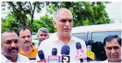
కాంగ్రెస్ ప్రభుత్వంపై మాజీ మంత్రి, బీఆర్ఎస్ సీనియర్ నాయకులు హాకీరావు మండిపడ్డారు. తెలంగాణ వైద్య విధాన పరిషత్ అనుపత్రుల్లో పనిచేస్తున్న శానిటేషన్, పేపర్ల కేర్, సెక్యూరిటీ సిబ్బందికి ఆరు నెలలుగా ప్రభుత్వం జీతాలు చెల్లించకపోవడం అమానుషమని అన్నారు. ఒకటో తేదీనే జీతాలు చెల్లిస్తున్నట్లు చెప్పుకునే ముఖ్యమంత్రికి వీరి వెతలు

ఈ యూట్యూబ్ లను సమ్ముకునే గత ప్రభుత్వం మీద ఆరోపణలు చేశారు కదా..? గత ప్రభుత్వం మీద అబద్ధాలు చెప్పించి అధికారంలోకి వచ్చావు కదా..? అనే యూట్యూబ్ చానెళ్ల నీ భందారాన్ని నీ అక్రమాలను, నీ అవినీతిని, నీ డొల్ల తనాన్ని సువ్వు మాట తప్పిన తీరును, ప్రజలకు చేసిన మోసాలను బయటపెడతంటే ఇవాళ నీవు తట్టుకోలేకపోతున్నావు. తట్టుకోలేక నీ అక్కసును యూట్యూబ్ చానెళ్లను ఎండగడుతున్నావు. నీ గురించి ప్రజలకు అర్థమైపోయింది. బిడ్డ నిన్ను గద్దె దించడానికే ఈ రాష్ట్రంలోని యూట్యూబ్ ఛానెళ్లు ఒక్కటైతాయి. నీ భందారాన్ని బయట పెడతంటే జాగ్రత్త అని రేవంత్ రెడ్డిని హాకీరావు హెచ్చరించారు. ముఖ్యమంత్రికి వీళ్ల వెతలు కనిపించడం లేదా.. కాంగ్రెస్ ప్రభుత్వంపై హాకీరావు ఫైర్