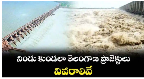
నిండు కుండలా తెలంగాణ ప్రాజెక్టులు వివరాలవే

ఆగస్టు రెండో వారం నాటికే నిండిన కృష్ణా బేసిన్ గోదావరి బేసిన్లు పోటెత్తుతున్న వరద క్రిరాసాగర్ 3.05 లక్షల క్యూసెక్కులు.. ఎల్లంపల్లికి 3.39 లక్షల క్యూసెక్కులు ఇన్నో ఫుల్ కెపాసిటీకి చేరుకున్న నిజాంసాగర్, సింగూరు సైనుంచి వరద.. దిగువకు నీటి విడుదల