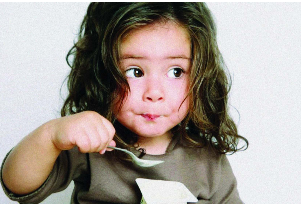
ఉత్పత్తులు, బీన్స్, కాయదాణాలు, గింజలు, తృణదాణాలు వంటి వివిధ రకాల ప్రోటీన్-రిచ్ ఫుడ్లను చేర్చండి. ప్లన్ క్లిస్టోవా వంటి మొక్కల ఆధారిత ప్రోటీన్లు అద్భుతమైన వనరులు.

శారీరక క్రమమే తగ్గిస్తుంది. పిల్లల్లో నీరసం పెరగవచ్చు. జుట్టు, చర్మం, గోళ్ల సమస్యలు: ప్రోటీన్ లోపం పిల్లల జుట్టు, చర్మం, గోళ్ల ఆరోగ్యాన్ని ప్రభావితం చేస్తుంది. జుట్టు విరగడం లేదా నన్నబడటం, పొడి, పొలుసుల చర్మం, బలహీనమైన లేదా విస్తరించిన గోర్లు సంభవించవచ్చు. అలసట: ప్రోటీన్ లోపం ఉన్న పిల్లలలో గాయం నయం కావడానికి సమయం పట్టవచ్చు. కాబట్టి, పిల్లలలో ప్రోటీన్ లోపాన్ని నివారించడానికి, మంచి మొత్తంలో ప్రోటీన్ కలిగిన సమతుల్య ఆహారం తీసుకోవాలి. ఎలా ఇక్కడ ఒక సాధారణ పరిష్కారం ఉంది. బేబీ డైట్లో ప్రోటీన్-రిచ్ ఫుడ్స్ ను చేర్చండి: మీ బేబీ డైట్లో లీన్ మాంసాలు, పౌల్ట్రీ, చేపలు, గుడ్లు, పాల