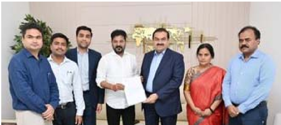
శుభ తెలంగాణ హైదరాబాద్