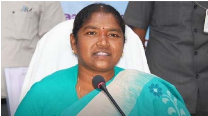
శుభ తెలంగాణ హైదరాబాద్

మూసీ నీళ్లతో స్నానం చేసేలా, తాగేలా తాము బాగు చేస్తామని మంత్రి సీతక్క అన్నారు. మూసీ పరీవాహక స్వయం సహాయ సంఘాల సభ్యులకు ఒక్కొక్కరికి రూ.2 లక్షల చెక్కులను సీతక్క పంపిణీ చేశారు. ఈ సందర్భంగా మూసీ నది ప్రక్షాళనపై ప్రతిపక్షాల నుంచి వస్తోన్న విమర్శలపై స్పందించారు. మూసీ పరీవాహక స్వయం సహాయ సంఘాల మహిళలకు తాము చేయాతనిస్తున్నామన్నారు. 172 స్వయం సహాయ సంఘాల సభ్యులకు రూ.3.44 కోట్ల రుణాలు ఇస్తున్నట్లు చెప్పారు. మనం - మగతా3లో