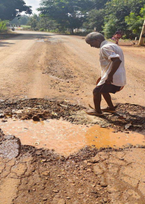
గురికాకుండా స్పందించి సమస్యలు పరిష్కరించాలని కోరుతున్నారు.