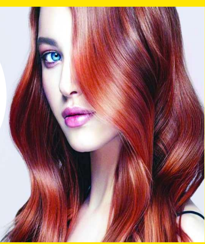
అంతేకాకుండా కొత్త ప్రొడక్ట్ వాడటంపై నిపుణుల సలహా తీసుకోవడం ఉత్తమం.

జుట్టుకు రంగు వేసుకున్న తర్వాత ఈ తప్పులు చేస్తే వేసుకొని కూడా వేస్ట్?